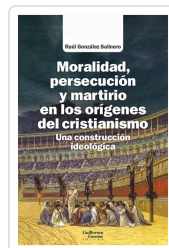
Moralidad, persecución y martirio en los orígenes del cristianismo González Salinero, Raúl