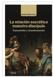
La relación socrática maestro-discipulo