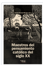
Maestros del pensamiento católico del siglo XX