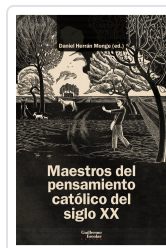
Maestros del pensamiento católico del siglo XX