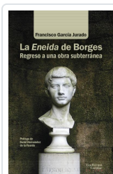
La Eneida de Borges García Jurado, Francisco