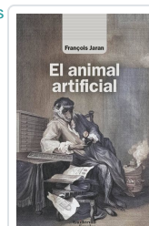
El animal artificial Jaran, François