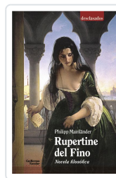
Rupertine. Novela filosófica Mainländer, Philipp