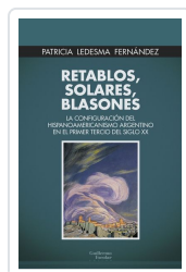
Retablos, solares, blasones Ledesma Fernández, Patricia