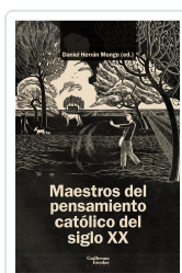
Maestros del pensamiento católico del siglo XX