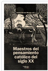
Maestros del pensamiento católico del siglo XX