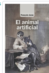
El animal artificial Jaran, François