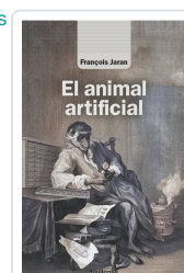
El animal artificial Jaran, François