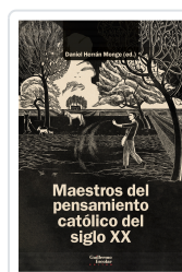
Maestros del pensamiento católico del siglo XX