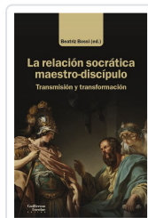
La relación socrática maestro-discipulo