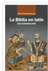
La Biblia en latín Canceleda Cilleruelo, Álvaro