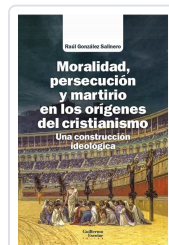
Moralidad, persecución y martirio en los orígenes del cristianismo González Salinero, Raúl