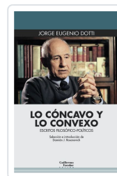
Lo cóncavo y lo convexo Dotti, Jorge Eugenio