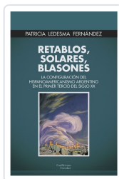
Retablos, solares, blasones Ledesma Fernández, Patricia