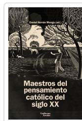
Maestros del pensamiento católico del siglo XX