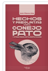
Hechos y preguntas sobre el conejo pato y otras piezas de filosofía ficción Vilanova Arias, Javier