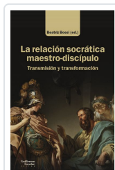
La relación socrática maestro-discípulo