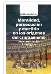
Moralidad, persecución y martirio en los orígenes del cristianismo González Salinero, Raúl