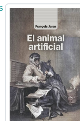
El animal artificial Jaran, François