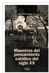
Maestros del pensamiento católico del siglo XX