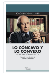
Lo cóncavo y lo convexo Dotti, Jorge Eugenio