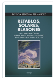
Retablos, solares, blasones Ledesma Fernández, Patricia