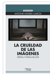
La crueldad de las imágenes Rivera García, Antonio