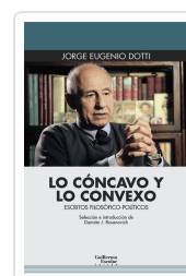
Lo cóncavo y lo convexo Dotti, Jorge Eugenio