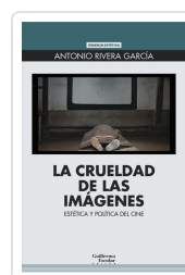
La crueldad de las imágenes Rivera García, Antonio