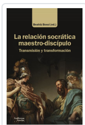
La relación socrática maestro-discípulo