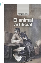
El animal artificial Jaran, François