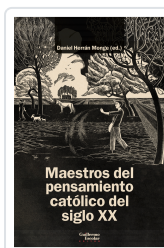
Maestros del pensamiento católico del siglo XX