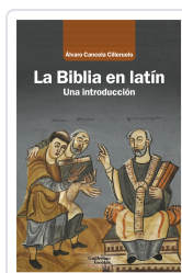
La Biblia en latín Canceleda Cilleruelo, Álvaro