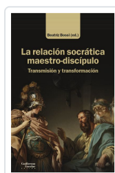
La relación socrática maestro-discípulo