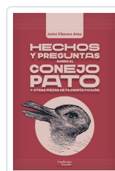
Hechos y preguntas sobre el conejo pato y otras piezas de filosofía ficción Vilanova Arias, Javier