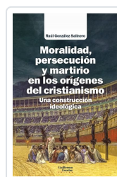
Moralidad, persecución y martirio en los orígenes del cristianismo González Sainero, Raúl