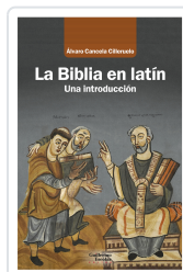
La Biblia en latín Canceleda Cilleruelo, Álvaro