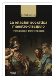
La relación socrática maestro-discípulo