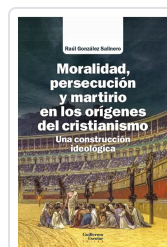
Moralidad, persecución y martirio en los orígenes del cristianismo González Salinero, Raúl