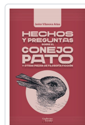
Hechos y preguntas sobre el conejo pato y otras piezas de filosofía ficción Vilanova Arias, Javier