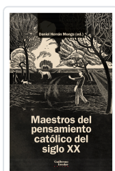
Maestros del pensamiento católico del siglo XX