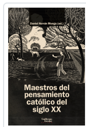
Maestros del pensamiento católico del siglo XX