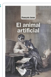
El animal artificial Jaran, François