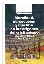
Moralidad, persecución y martirio en los orígenes del cristianismo González Salinero, Raúl