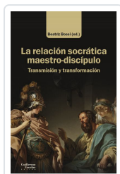
La relación socrática maestro-discipulo