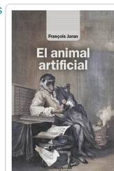
El animal artificial Jaran, François