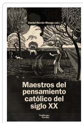
Maestros del pensamiento católico del siglo XX