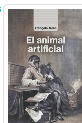
El animal artificial Jaran, François