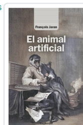
El animal artificial Jaran, François