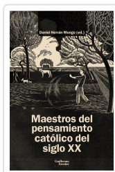
Maestros del pensamiento católico del siglo XX