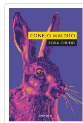
CONEJO MALDITO Chung, Bora