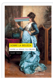
Sobre la belleza. Entre la Venus y el Ciborg Naief Yehya