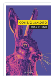
CONEJO MALDITO Chung, Bora