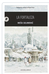
La fortaleza Selimovic, Meša