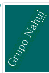
Infancia Gorki, Maksim