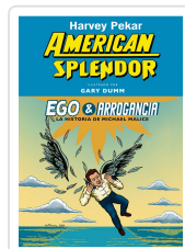
Ego & Arrogancia Pekar, Harvey; Dumm, Gary