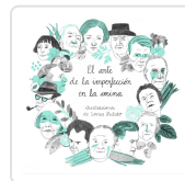
El arte de la imperfección en la cocina Varios autores