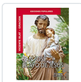
San José el ayo de Jesús Gracias de la Madre de Dios, Fray Gerónimo