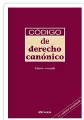
Código de Derecho Canónico Instituto Martín De Azpilcueta