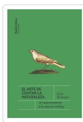
El arte de contar la naturaleza Romero, Luci