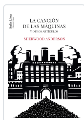
La canción de las máquinas Anderson, Sherwood