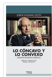
Lo cóncavo y lo convexo Dotti, Jorge Eugenio