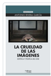
La crueldad de las imágenes Rivera García, Antonio