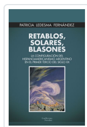
Retablos, solares, blasones Ledesma Fernández, Patricia