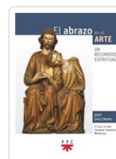
El abrazo en el arte Daelemans, Bert