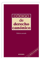
Código de Derecho Canónico Instituto Martín De Azpilcueta