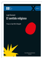
El sentido religioso Giussani, Luigi