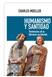
Humanismo y santidad Moeller, Charles