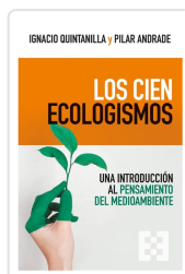
Los cien ecologismos Quintanilla Navarro, Ignacio; Andrade Boué, Pilar