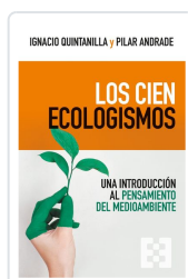
Los cien ecologismos Quintanilla Navarro, Ignacio; Andrade Boué, Pilar