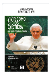
Vivir como si Dios existiera Ratzinger (Benedicto XVI), Joseph