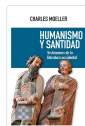
Humanismo y santidad Moeller, Charles