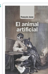
El animal artificial Jaran, François