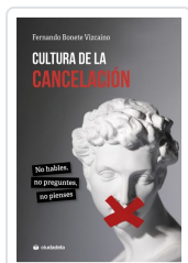
Cultura de la cancelación Bonete Vizcaino, Fernando