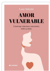
Amor vulnerable Sabaté, Laia