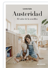
Austeridad Gala, Loreto