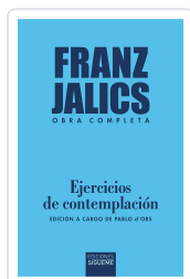
Ejercicios de contemplación Jálics, Franz