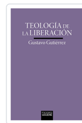
Teología de la liberación Gutiérrez, Gustavo